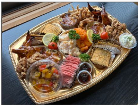
オードブル 6-7人前 7,500円（税込）

ローストビーフ、手羽先、マリネ、 エビチリ、エビマヨ、ミニグラタン、 卵焼き、唐揚げ、イカげそ、 アジ南蛮漬け など 計11品