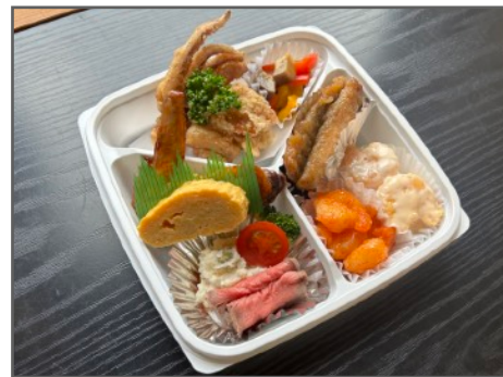
ミニオードブル 1,600円（税込）

ローストビーフ、手羽先、マリネ、 エビチリ、エビマヨ、卵焼き、 唐揚げ、イカげそ、 アジ南蛮漬け など 計10品