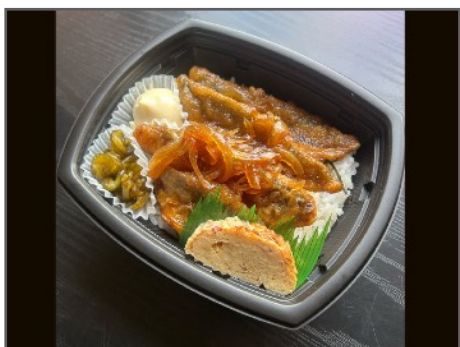
アジ南蛮井 850円（税込）