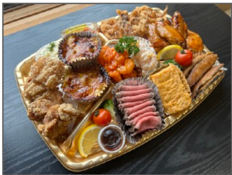
オードブル 4-5人前 5,500円（税込）

ローストビーフ、手羽先、マリネ、 エビチリ、エビマヨ、ミニグラタン、 卵焼き、唐揚げ、イカげそ、 アジ南蛮漬け など 計11品