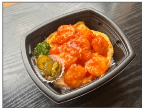
エビチリ井 850円（税込）